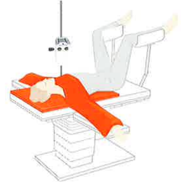
ASTOPAD COV105 ASTOPAD COV155