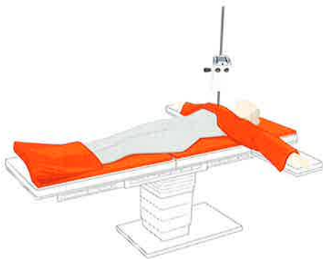
ASTOPAD COV105 ASTOPAD COV150 ASTOPAD PAS155