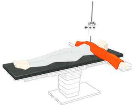
ASTOPAD SOF2 ASTOPAD COV155