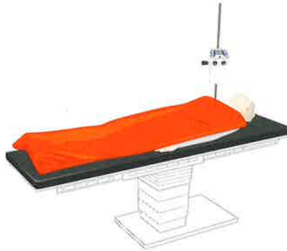
ASTOPAD SOF2 ASTOPAD COV180