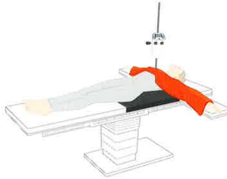
ASTOPAD SOF4 ASTOPAD COV155